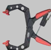
Strettoio a cricco XCR